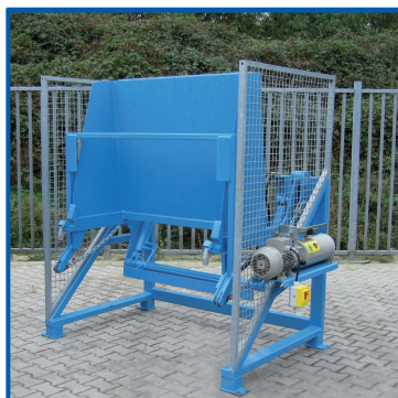
Stationäre HKV mit Zapfenaufnahme für MGB 1,1 cbm

Unsere Hub-Kippvorrichtungen können wir in den unterschiedlichsten Ausführungen anbieten: