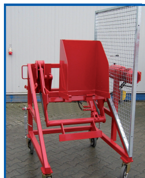
Fahrbare HKV mit Kammaufnahme für 120 l MGB