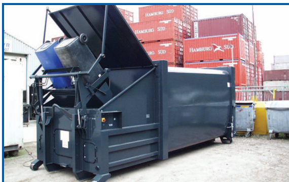
Hub-Kippvorrichtung mit automatischer Deckelöffnung beim SPB