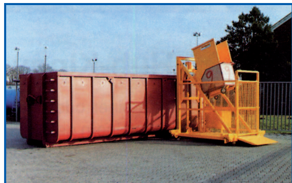
Motorisch verfahrbare HKV für Sonderbehälter, Kipphöhe 2500 mm