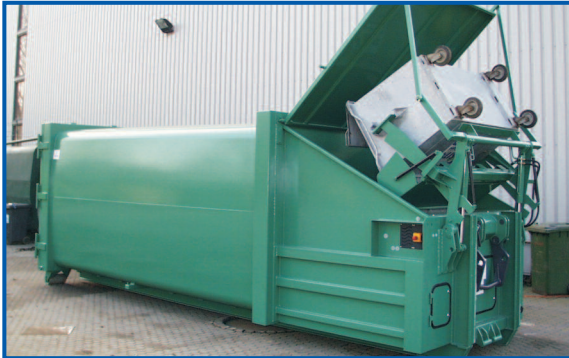
SPB 20 mit angebauter HKV für 1,1 cbm-Behälter