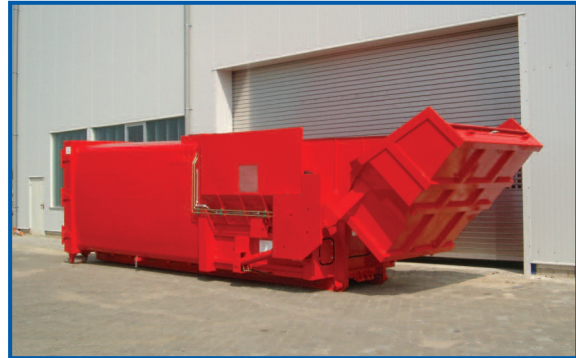
SPB 20 SEL-E mit Ladeschaufel